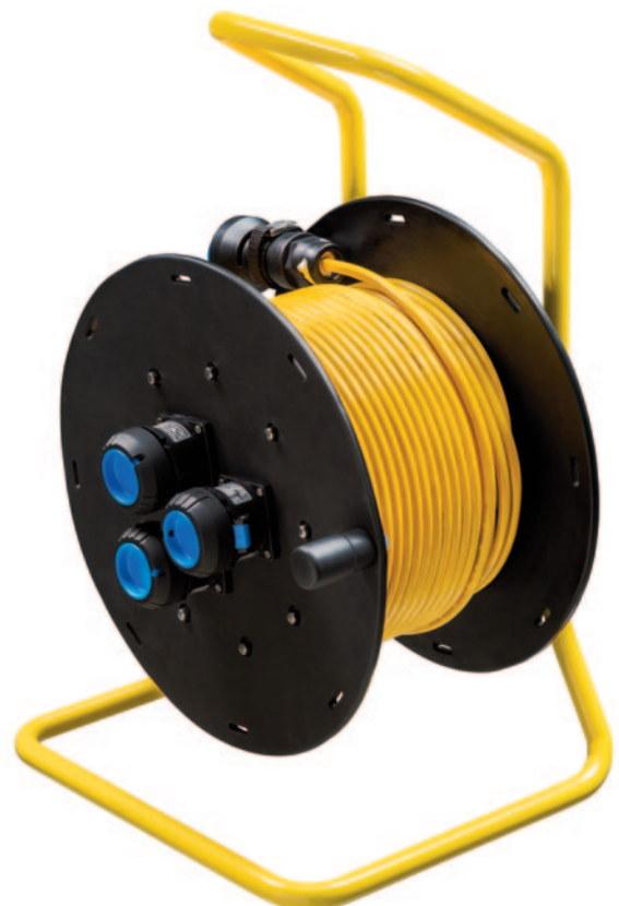
Kabelrolle / enrouleur de câble / cable reel CR 27